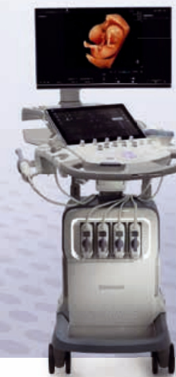
Voluson Signature 18