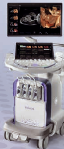
Voluson Expert 22