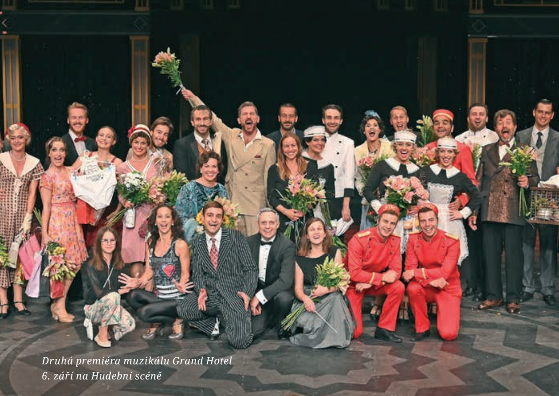
Druhá premiéra muzikálu Grand Hotel 6. září na Hudební scéně