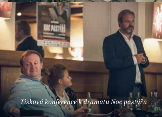
Tisková konference k dramatu Noc pastýřů