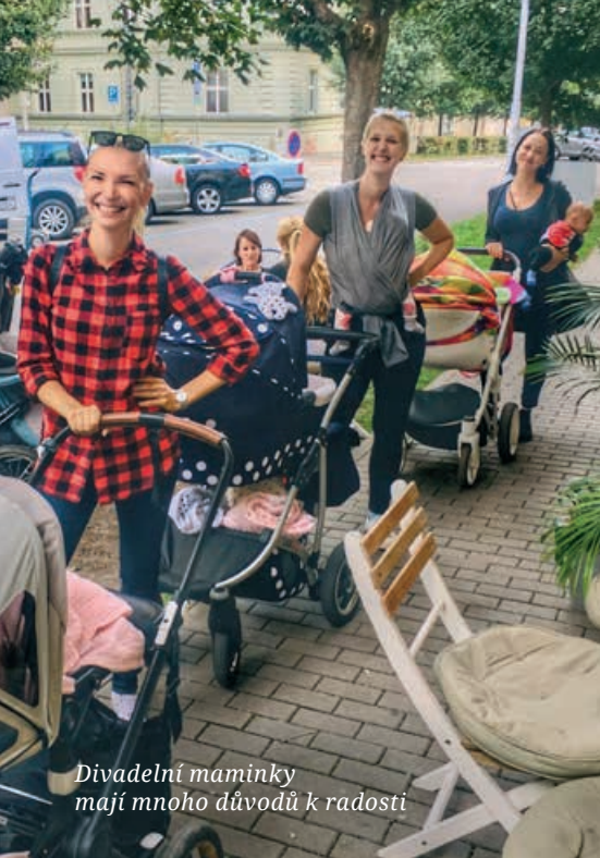
Divadelní maminky mají mnoho důvodů k radosti